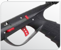
Scatola di sgancio in tecnopolimeri caricati e meccanismo di scatto in acciaio Inox. Boîtier de détente en technopolymères chargés et mécanisme de gâchette en acier Inox.