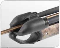
Testata innovativa. Tête innovante.

Velocità senza rinunce. Vitesse sans sacrifices.