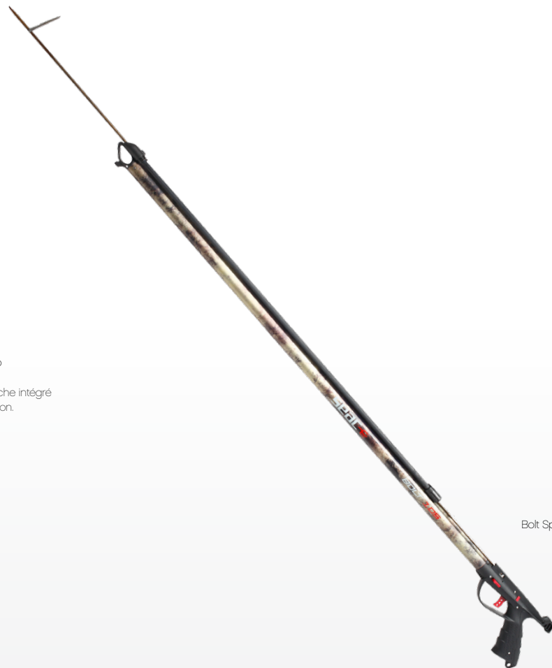
Bolt Special Combat

Canna: canna in lega di Alluminio con sella guida-asta integrato e trattamento mimetico ottenuto per sublimazione.