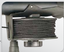
Mulinello (opzionale). Moulinet (en option).